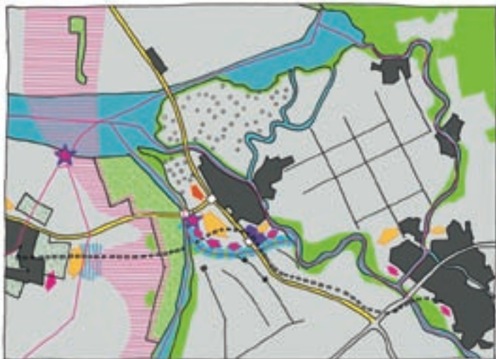
Figuur 2. PKB en Masterplan naast elkaar. Links is te zien welke ruimtelijke reservering de PKB heeft gemaakt voor verschillende maatregelen, waaronder de bypass die op de langere termijn in dit gebied hoe dan ook noodzakelijk is. Rechts is verbeeld aan welke oplossing de betrokken partijen de voorkeur geven in het Masterplan: een nieuw aan te leggen bypass, onderlangs (zuidwaarts) van Kampen. Ambities voor nieuwe woningbouw en bedrijvigheid ten zuidwesten van Kampen maken onderdeel uit van het Masterplan.

Ten tweede de Kaderrichtlijn water. Deze heeft als doel de kwaliteit van de wateren in de Europese Unie in een goede toestand te brengen en te houden. Per waterlichaam wordt in de stroomgebiedbeheersplannen vastgelegd wat die goede toestand is, ofwel wat de doelen zijn en hoe deze bereikt kun-