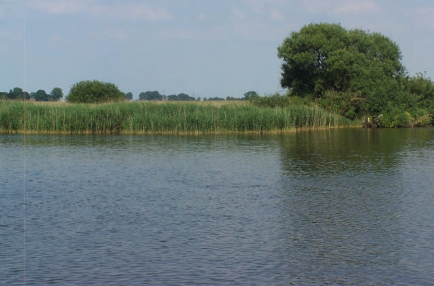
Rietoevers aan Vossemeer en Drontermeer.